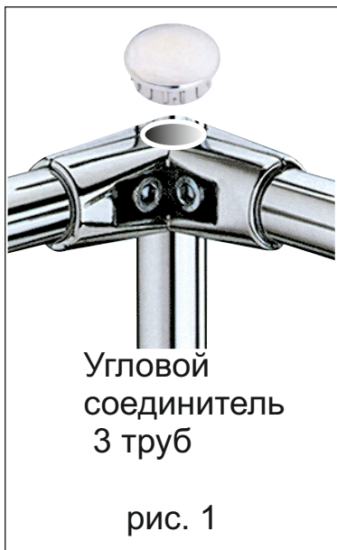
Угловой соединитель 3 труб